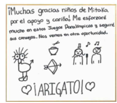
銀メダルを獲得したマリアナ選手の色紙