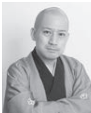
春風亭一之輔

押しも押されぬ人気と実力の春風亭一之輔師匠の落語を、たっぷりとお楽しみください。