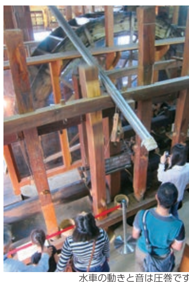
水車の動きと音は圧巻です

◆精米・製粉作業特別公開 江戸時代から昭和40年代まで使われていた日本有数の水車「新車(しんぐるま)」を実際に稼働させ、精米・製粉作業の様子を特別公開します。見学者には後日、精米したお米をプレゼントします。 人 各日60人(午前10時～正午=24人<市内在住の方のみ>、午後1時～4時=36人) 申 10月4日(月)午前9時30分から同課 ☎内線2922へ(先着制)