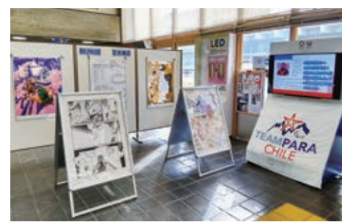
選手のメッセージ動画と公式アートポスター

三鷹市ゆかりの選手の活躍や、東京パラリンピックに向けてチリ選手団が8月6日～21日に市内で行った事前キャンプの様子などを展示します。