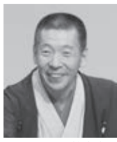
柳亭市馬