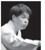
立川志らく

PARTNER 財団主催の公演チケットまたはチケット半券で、三鷹駅周辺などの「チケットパートナーショップ」協力店でさまざまなサービスが受けられます(サービス有効期間は公演日から7日間)。