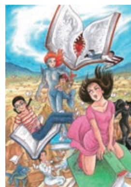
「菜と紙魚子」カラー原画 2015年 ©諸星大二郎