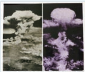
ヒロシマ・ナガサキ 原爆と人間