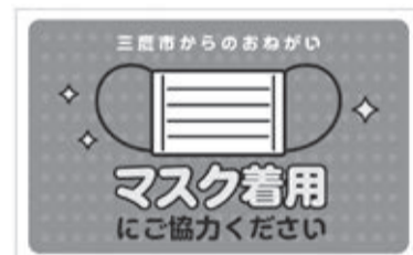
食事時のマスク着用を来店者に呼び掛けるメッセージカード

市では、新型コロナウイルス感染症の感染拡大防止対策として、市内の飲食店に来店者向けのメッセージカード、マスク、手指用のアルコール消毒液をお届けしています。ぜひご活用ください。 ※飲食店で、5月16日(日)までに届かない場合は同課へご連絡ください。