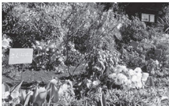
ボランティアが管理している花壇

申 5月7日(金)までに往復はがきまたはインターネットで必要事項(11面参照)、同協会会員は会員番号を「〒181-0012上連雀8-3-10NPO法人花と緑のまち三鷹創造協会」・HP https://hanakyokai.or.jp/ へ(申込多数の場合は抽選)