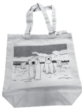
販売しているトートバッグ