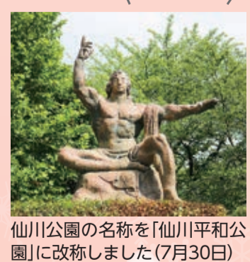
仙川公園の名称を「仙川平和公園」に改称しました(7月30日)