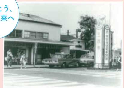
昭和42年の三鷹駅 三鷹駅が開業90周年を迎えました(6月25日)