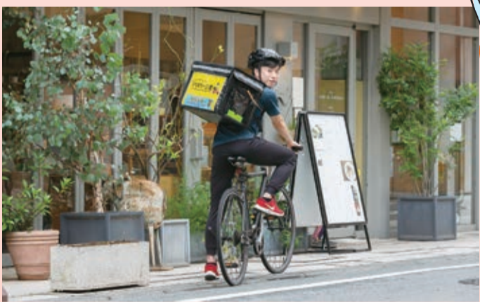
「デリバリー三鷹」の宅配サービスが市内全域でスタート(7月20日~)