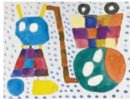
障がいのある方が制作した絵画