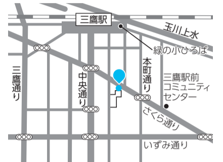
●閉鎖型公衆喫煙所(仮設)