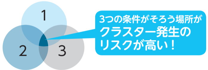
イラストは「厚生労働省ホームページ」より