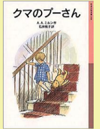
「くまのプーさん」 A. A. ミルン作 石井桃子訳(岩波書店)

主 市、三鷹市文庫連絡会 日 2月22日(土)午後2時～4時(1時45分から受付開始) 人 70人 所 三鷹駅前コミュニティセンター 申 当日会場へ(先着制)