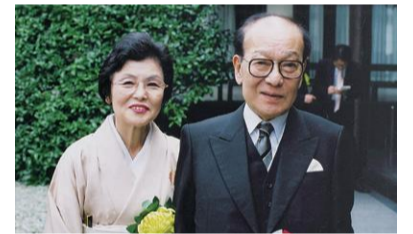
津村節子・吉村昭(平成15年)

主 市、NPO法人三鷹ネットワーク大学推進機構 日 3月14日(土)午後3時30分～5時 (3時から整理券を配布し開場) 人 100人 所 同大学 申 当日会場へ(先着制)