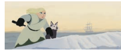
(レミ・シャイエ/2015年/81分/フランス・デンマーク)

19世紀ロシアの貴族の娘であるサーシャは、1年前に北極探検に出たまま行方が分からなくなった祖父のことをいつも想っていた。ある日、祖父がたどった航路を示すメモを見つける。再び探検船を出すことを誰からも聞き入れてもらえなかったサーシャは、自ら祖父を探す旅に出掛ける。