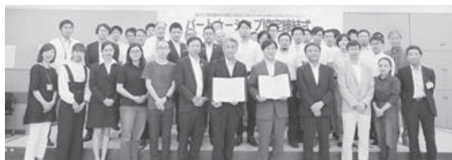
「パートナーシップ協定締結式」

「まちづくりディスカッション」では市民同士の議論を公平に進めるために、市民による実行委員会が中立な立場で運営を行っています。今回は7月10日(水)にNPO法人みたか市民協働ネットワークと「みたかまちづくりディスカッション」の実施に関するパートナーシップ協定を締結し、実行委員会を設置しました。