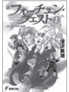
「新フォーチュン・クエスト」イラスト/迎 夏生

申 2月19日(火)から同館 ☎43-9151へ(先着制。手話通訳希望者は3月1日(金)まで)