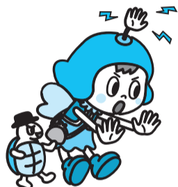
三鷹市詐欺被害防止キャラクター「チョット待ったさんとたしカメくん」

ニュースに取り上げられ、市内でも再三注意を呼び掛けていますが、特殊詐欺の被害は後を絶ちません。年々手口が巧妙化しており、特に女性や高齢者を狙った詐欺が多発しています。「私には関係のないこと…」と考えていたら大間違い。特殊詐欺の魔の手は、あなたのすぐそばに潜んでいます。