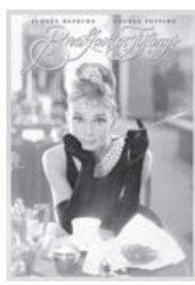
「ティファニーで朝食を」 ACADEMY AWARD® AND OSCAR® ARE THE REGISTERED TRADEMARKS AND SERVICE MARKS OF THE ACADEMY OF MOTION PICTURE ARTS AND SCIENCES.

芸術文化センター 星のホール 全席指定 3月16日(土) 各回1本立て/昼夜入替制 昼の部 午後1時/夜の部 午後4時 上映開始 チケット発売中 各回 会員=450円 一般=500円 学生=400円 「ティファニーで朝食を」 (1961年/アメリカ/115分/カラー/Blu-ray) 協力: (株)東京現像所 劇中、オードリー・ヘプバーンが窓辺で歌う名曲「ムーン・リバー」の旋律が心に染み渡る、永遠の名作!