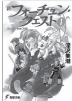
『新フォーチュン・クエスト』イラスト/迎 夏生

申 2月19日(火)から同館☎43-9151へ(先着制。手話通訳希望者は3月1日(金)まで)