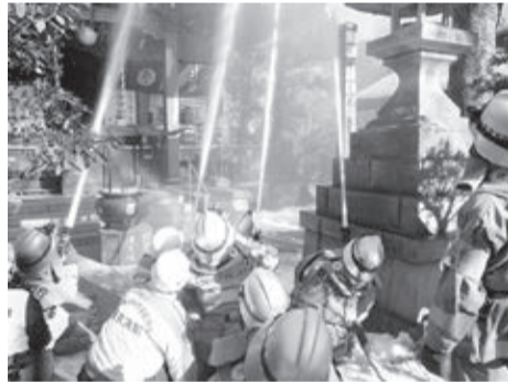
昨年の様子(井の頭弁財天)

火災や地震などの災害から、これらの文化財を地域全体で守るため、日頃からの防災対策にご協力ください。