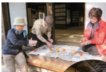
古民家での生活を伝えるボランティア(干し柿を作る様子)