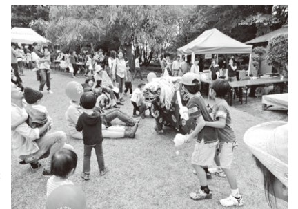
牟礼の里公園秋まつりの様子

※牟礼の里公園秋まつり、丸池わくわくまつりには「みたか太陽系ウォーク2017 スタンプラリー」の当日限定「彗星(すいせい)スタンプ」を設置します。