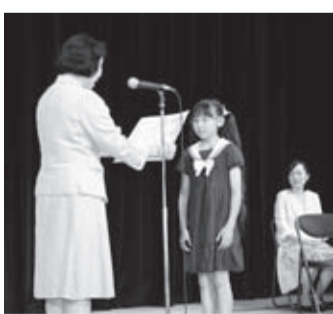
平成27年度環境標語表彰式の様子

これからも、ごみの減量・リサイクルや、防犯・安全に配慮しつつ行っていたらいいですね。省エネ活動など、市民の皆様が意識して省エネ活動をしていただくことにより、地域から地球の温暖化を防いでまいりましょう。環境が一人ひとりの取り組みで守られ、向上しますように、皆様の一層の環境問題への注目とご活躍をお願いいたします。