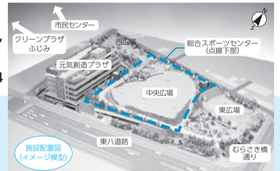
※総合スポーツセンターの範囲を示す点線はおおよそのものです。

※プール・トレーニング室・ランニング走路は、常時個人使用が可能です(大会などの貸切使用時を除く)。そのほかの施設の個人使用については時間帯や競技種目の指定があります。 ※新施設は、調布市と共同設置のごみ処理施設「クリーンプラザふじみ」で発生する電力を活用するため、調布市在住の方も「市民」の料金で使用できます。