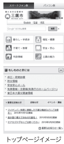
トップページイメージ

※ページ上下にある「スマートフォン版/パソコン版」のボタンにより、簡単に表示を切り替えることができます。