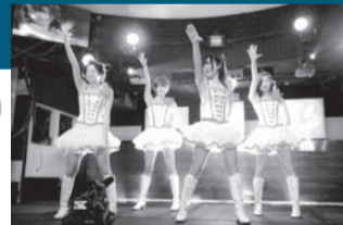
【少女は異世界で戦った】