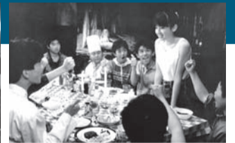
【ぼくらの七日間戦争】