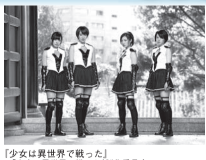
『少女は異世界で戦った』