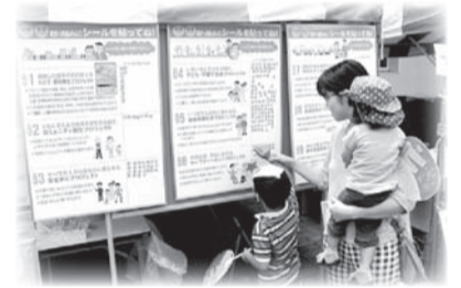
7月の「みたか商工まつり」で行われたシール投票の様子