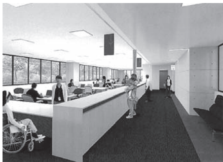
保健センター完成イメージ