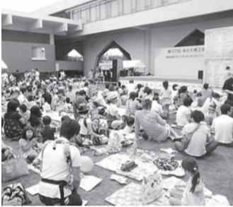
昨年の会場の様子