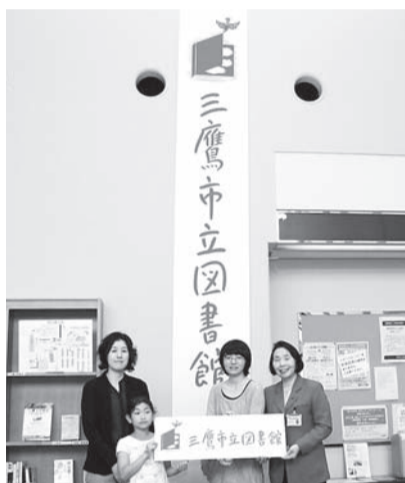
ロゴマークお披露目会の様子

5月12日に三鷹図書館(本館)で開催されたロゴマークお披露目会では、清原慶子三鷹市長