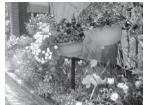
昨年の応募写真から

※くわしくは募集要項(同協会、市緑と公園課(市役所5階56番窓口)、コミュニティセンター)で配布。市ホームページや同協会ホームページ HP http://hanakyokai.or.jp/ (からも入手可) をご覧ください。