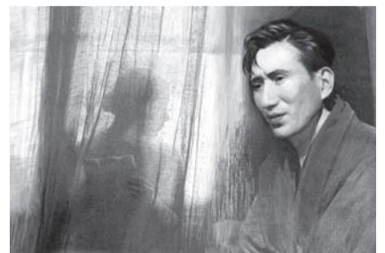
画：水津燧(みなづ・ひとる)