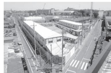
新川防災公園・多機能複合施設(仮称)の工事状況(平成27年5月時点)