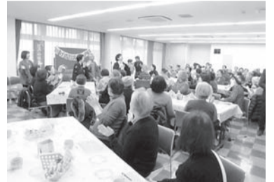
地域ケアネットワーク(連雀サロン)