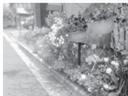
昨年の応募写真から