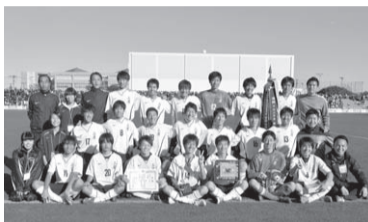
都大会で優勝し喜ぶ選手たち

みたか観光案内所、三鷹産業プラザ、TIFOSI(ティフォージ・下連雀5-8-1シティコート下連雀)で、12月19日から公式応援グッズ(ジャンパー・メガホンのセット=2,000円)を販売しています。グッズを持って応援に行きましょう。