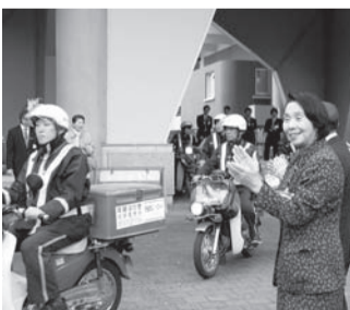
11月11日に開催した三鷹郵便局によるパトロール活動出発式にて