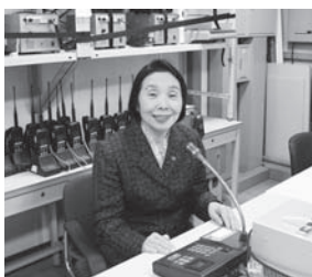
防災無線などの情報発信を行う市役所の通信室にて

年末が近づき寒さも増しています。火災予防も含めて、防災についてご家族、学校、職場で語り合っていたら、「自助」「共助」の強化をお願いいたします。