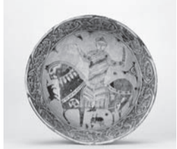
多彩騎馬人物文鉢

古代エジプトの木棺やカバの形をした像(ファイアンス焼き(写真))など、中近東地域の歴史的に貴重な収蔵品をぜひご覧ください。従来は予約制ですが、下記期間に限り市民は予約不要・無料で鑑賞できます。民族衣装体験(有料)もできます。