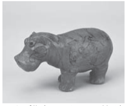
カバ像(ファイアンス焼き)

日 10月22日(水)～26日(日)午前10時～午後5時(最終入場は4時30分まで) 人 在学・在勤を含む市民 物 住所を確認できるもの 問 コミュニティ文化課 ☎内線2515 ※在学・在勤を含む市民以外の方は一般1,000円、高校生・大学生・65歳以上500円が掛かります。