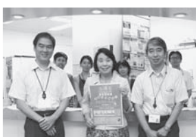
ネットワーク大学の窓口にて太陽系ウォークスタンプラリーのマップを手に入れた様子