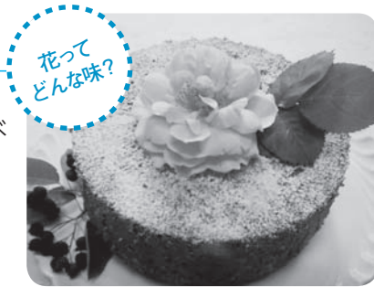
エディブルフラワーを使ったケーキ