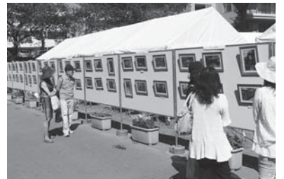
昨年のパネル展示の様子

過去最多となる市民のみなさん125人からご応募いただいた、すてきなお庭や風景の写真130点を展示します。イベント終了後は、市役所で展示します(下記参照)。また、簡単なティーコーナーもありますので、交流の場としてご利用ください。