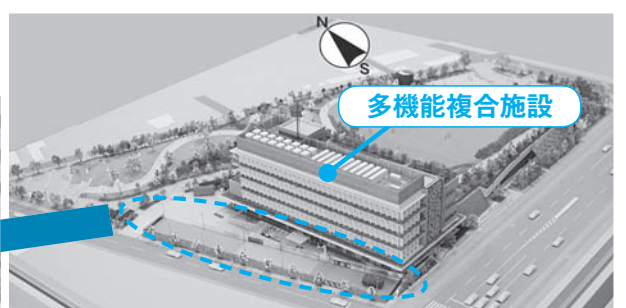
新施設南西側上部より(完成イメージ模型)