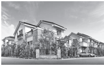
「景観協定」を認可した中原一丁目の住宅地(イメージ)

このたび、景観法に基づき、土地所有者などの合意により、区域内の建築物の形態や色彩、緑化など、住民のみなさんが守るべき地域の自主的なルール(基準)を定めた「景観協定」を、市内で初めて認可しました。