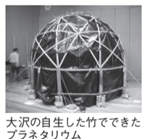
大沢の自生した竹でできたプラネタリウム

(1回15分程度、全6回) ④各回15人(未就学児は保護者同伴) ④1回100円(中学生以下無料)