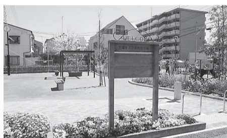
下連雀六丁目防災広場