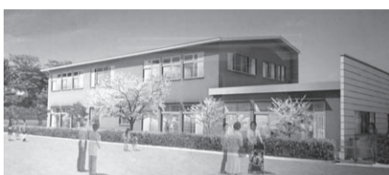
井の頭・玉川上水周辺地区複合施設(仮称)外観イメージ