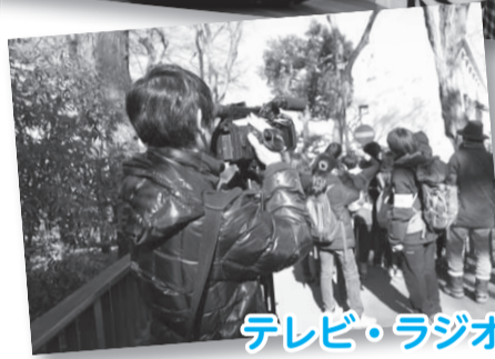
テレビ・ラジオから