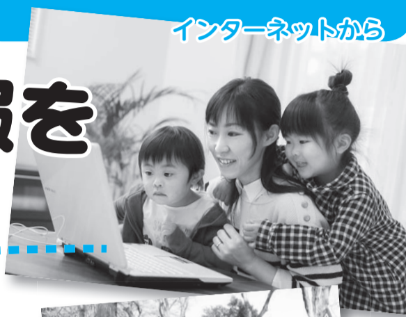
インターネットから