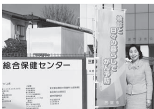
三鷹市総合保健センターの前で

4月に入り、咲き誇る桜をはじめとする花々や、新入園児や新入生の初々しい笑顔が、私たちに「元氣」を与えてくれます。進学や転居など、生活環境の変化が多い春には、「元氣」が欠かせませんが、「元氣」といえば、病気がケガから身を守る健康管理や健康づくりが重要です。さて、三鷹市では、三鷹市総合保健センターが編集している「健康ガイドみたか」を4月に各世帯にお配りしています。「健康ガイドみたか」は、三鷹市が行っている各種健康診断等の日程や受診方法などについて詳しくご案内している印刷物です。また、胃がん、肺がん、大腸がん、乳がん、子宮がん、前立腺がんなどのがん検診については年齢等の受診資格や、いつどのように申し込めば、どの時期に受診することができるのか、費用は有料か無料かなどを詳しく紹介しています。今年度は、新規事業として、胃がんリスク検診(ABC検診)を導入しました。これは、血液検査によって、がんの原因とされるヘリコバクター・ピロリ菌が胃にいるかどうか、胃が萎縮(老化)していないかどうかを検査して、それをA・B・C・Dの段階でお知らせして、必要に応じてさらに胃カメラの検査などをする判断に役立てていただくものです。また、B型、C型肝炎のウイルス検査などもご案内しています。健康管理や健康づくりのためには、お一人おひとりが自分の健康を気遣い、まずは体調をよく知るとともに、検診や健康診断を受けていただき、その結果によって必要な治療を受けたり、適切な食事や運動を心がけることが大切です。「健康ガイドみたか」は、市民の皆様の健康管理や健康づくりに活用していただける健康診断等に関する情報が記載されています。どうぞ、じっくりと内容をお読みいただき、がん検診等の機会を利用してください。「健康ガイドみたか」を活用して、皆様がお元氣でありますように心から願っています。