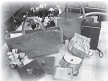
自主製品の一例。ハンドメイドの小物など。