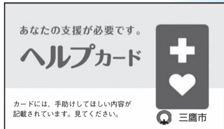
裏面に手助けしてほしい内容が記載されています。

「ヘルプカード」は、障がいのある方が災害時や日常生活の中で困ったときに、周囲に手助けを求めするためのカードです。特に、聴覚障がいや内部障がい、知的障がいなど、一見障がいのあることがわからない方が助けを求めるときに役立ちます。カードをお持ちの方を見かけたら、ぜひ温かい配慮をお願いします。