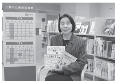
開館準備が進む南部図書館にて新しい本を手