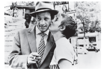
「勝手にしやがれ」