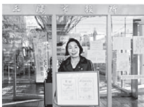
本庁舎正面玄関でISO14001更新審査の登録証を手に

三鷹商工会ホームページ HP http://www.mitaka-s.jp/ トップページ「最新情報」▶「三鷹むらさき商品券販売状況」 ※携帯電話からも、パソコン版サイトにつながります。通信料は利用者負担です。