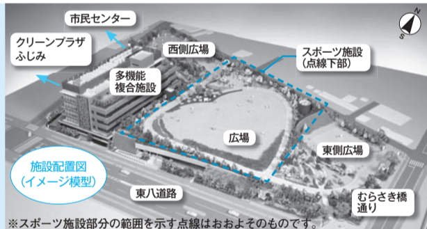
※スポーツ施設部分の範囲を示す点線はおおよそのものです。

市民のみなさんの安全安心と市民サービスの向上を図るため、市役所東側の東京多摩青果(株)三鷹市場跡地(新川6丁目)を中心とした約2.0haに、防災公園として災害時の一時避難場所となる公園施設とその下部にスポーツ施設を整備するとともに、老朽化し耐震性に課題のある6つの公共施設などを集約化し、防災センター機能を加えた多機能複合施設を一体的に整備します。また、防災機能の向上のため、敷地北側の市道を拡幅し、周辺道路の無電柱化を実施します。事業の推進に当たっては、独立行政法人都市再生機構の防災公園街区整備事業として国庫補助金を活用するなど財政負担の軽減を図り、早急な整備を目指します。