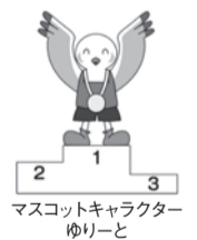
マスコットキャラクター ゆりーと