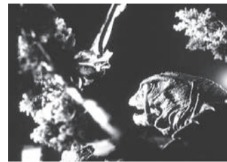
「ガメラ 大怪獣空中決戦」