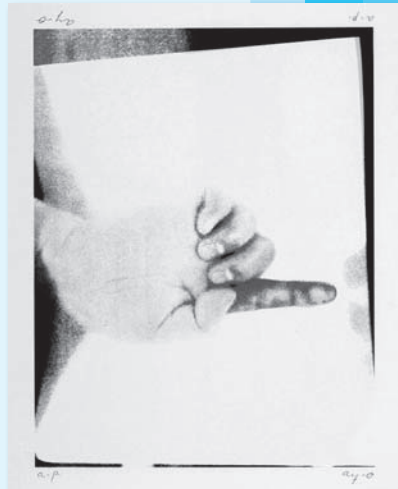
巖嘔 《Then, Mr. Ay-O got drunk by the Rainbow 38》 1974年 シルクスクリーン

三鷹市美術ギャラリー JR三鷹駅(南口)CORAL5階 ☎0422-79-0033 http://mitaka.jpn.org/gallery/