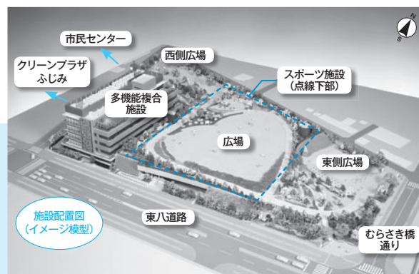
※スポーツ施設部分の範囲を示す点線はおおよそのものです。