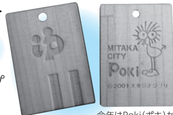
今年はPoki(ポキ)が刻印されています。

☎12月31日(火)まで ☎春の湯(下連雀3-37-12)、アサヒトランド21(上連雀2-7-1)、神明湯(牟礼3-8-16)、千代乃湯(井口2-4-31)、のぼり湯(井口5-5-18) ☎のぼり湯☎0422-31-7645、市生活経済課☎内線2542