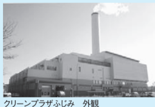
クリーンプラザふじみ 外観

ふじみ衛生組合では、4月に本格稼働した可燃ごみ処理施設「クリーンプラザふじみ」の施設見学を受け付けています。お気軽にお申し込み・ご来所ください。 ※併設するリサイクルセンターは、施設内への立ち入りができないため、別途DVDでご紹介します。 日 月 金曜日(年末年始を除く) 午前9時~正午、午後1時~4時30分 申 問 ①個人 ②当日 直接施設へ(説明員による説明が必要) 方 方は事前に電話で申し込み、②団体 ③見学希望日の3カ月前から1カ月前までに同組合(見学受付専用) ☎0424248 20781へ