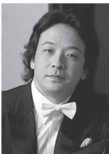
沼尻竜典

出演/沼尻竜典(音楽監督・指揮)、黒澤麻美(ソプラノ)、デニス・ピシュニャ(バス)、TMP(管弦楽) 曲目/プロコフィエフ:交響曲第1番ニ長調op.25 「古典交響曲」、ショスタコーヴィチ:交響曲第14番op.135「死者の歌」