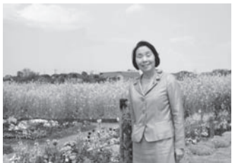
花と緑の広場で三鷹の美しい風景を感じながら

三鷹市の景観、風景を、三鷹らしく、美しく、暮らしやすいものにしていくために、皆様がこのガイドラインのご活用と、景観づくりへの注目、ご参画をお願いします。