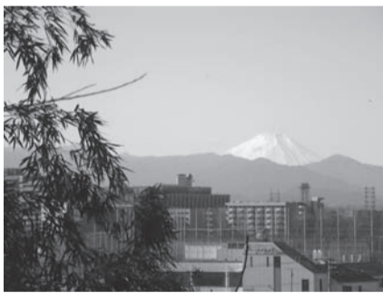
国分寺崖線からの眺望

大沢の里の自然を保全するとともに、崖線上部や下部からの眺め、緑と水の豊かな環境に配慮した景観づくりを行います。