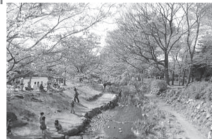
井の頭公園駅付近の親水空間 連続的な自然の景観を形成している神田川の周辺では、河床の植生や遊歩道と調和した景観づくりを行います。