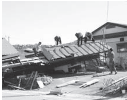
震災により倒壊した福島県矢吹町内の家屋