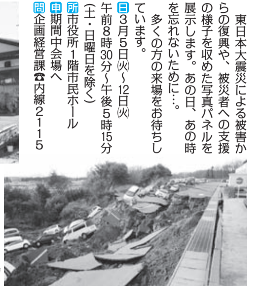
震災直後の福島県矢吹町内駐車場の様子

東日本大震災による被害からの復興や、被災者への支援の様子を収めた写真パネルを展示します。あの日、あの時を忘れないために...。多くの方の来場をお待ちしています。 ☎3月5日(火)～12日(火) 午前8時30分～午後5時15分 (土・日曜日を除く) ☎所 市役所1階市民ホール ☎期間 中会場へ ☎問 企画経営課☎内線2115