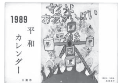
1989年に制作された第1作の平和カレンダー

日 3月3日(日)～8日(金) 午前10時～午後5時(4日(月)を除く) 所 三鷹市公会堂 さんさん館(2階展示室兼会議室)