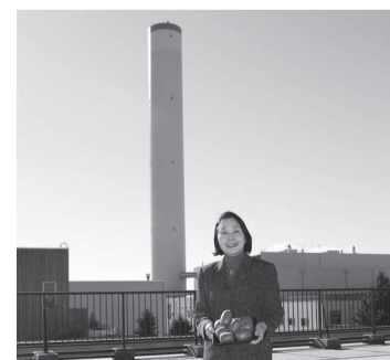
三鷹産キウイフルーツを手に、新ごみ処理施設の前で