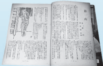
「眉山」が掲載された「小説新潮」昭和23年3月号

10月16日(火)～平成25年2月3日(日) 午前10時～午後5時30分 ※休館日=月曜日(月曜日が祝日の場合は開館し、翌日と翌々日を休館)、年末年始(12月29日～1月4日)。 ☎同サロン ☎0422-26-9150 ※ガイドボランティアによる太宰治の足跡案内もあわせてご利用ください(午前10時30分～午後4時30分)。